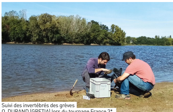
Suivi des invertébrés des grèves O. DURAND (GREZIA) lors du tournage France 3*.

L'évaluation des effets des travaux de restauration réalisés dans le cadre du contrat sur les milieux physiques et biologiques, implique une bonne appropriation des états de référence.