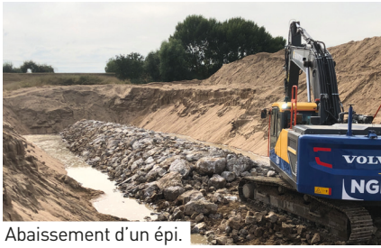
Abaissement d'un épis.