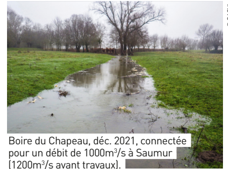
Boire du Chapeau, déc. 2021, connectée pour un débit de 1000m 3 /s à Saumur (1200m 3 /s avant travaux).