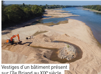
Vestiges d'un bâtiment présent sur l'île Briand au XIX e siècle.

Suite à ces diagnostics, la DRAC a prescrit des fouilles archéologiques dont les trois premières seront réalisées à l'étiage 2022 . Après un appel d'offres ouvert mené en fin d'année 2021, c'est l'Inrap qui a été retenu pour la réalisation de ces travaux.